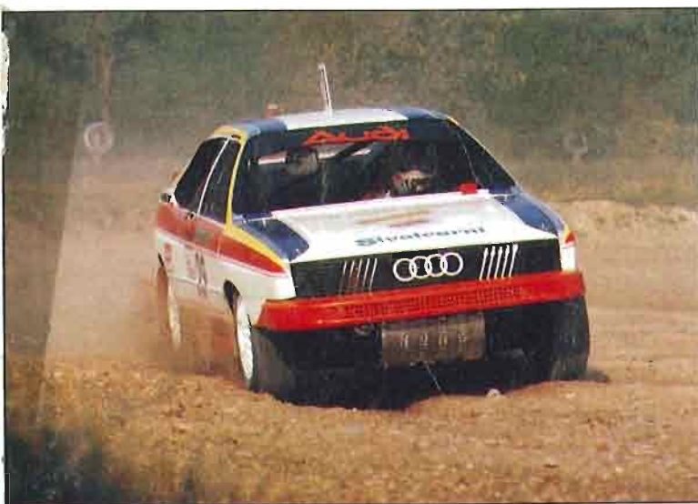
Nell'ambiente dell'autocross c'è molto fermento a livello tecnico: sopra, Binci con la Porsche, a lato, Romagna con l'Audi opportunamente modificata e, sotto, Savio con Lancia 037 dietro a un'Audi, testimoniano come i Gruppi B abbiano trovato un nuovo interessante terreno di conquista